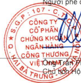
Ông Trần Phúc Vinh Chủ tịch Hội đồng Quản trị