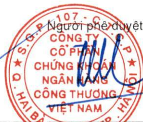
Ông Trần Phúc Vinh Chủ tịch Hội đồng Quản trị