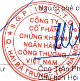
Ông Trần Phúc Vinh Chủ tịch Hội đồng Quản trị