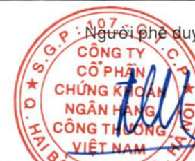
Ông Trần Phúc Vinh Chủ tịch Hội đồng Quản trị